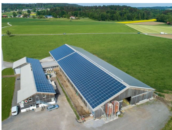
Blick auf den Gemeinschaftsstall der Betriebszweiggemeinschaft Ehrenbüel in Fehraltorf ZH

Offenbar hält die Angst vor zwischenmenschlichen Konflikten und vor dem Verlust der Selbständigkeit viele Betriebsleitende vor einem Schritt in die Kooperation ab. Bei einer Umfrage sind diese Befürchtungen von den befragten Landwirtinnen