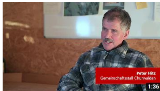
Trailer zum Thema "Zusammenarbeit bringt dich weiter" auf Youtube

und Landwirten als wichtigste Schwächen genannt worden 3 . Eine weitere Ursache für den zögerlichen Einstieg in Kooperationen liegt wohl auch daran, dass zu wenige Informationen über die Rahmenbedingungen und den Umsetzungsprozess von Zusammenarbeitsprojekten verfügbar sind.