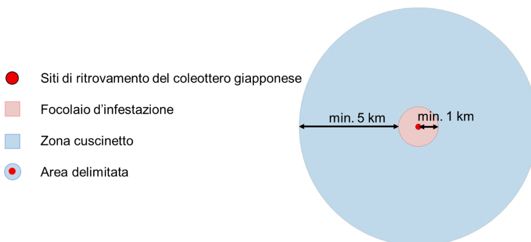
Figura 1: rappresentazione schematica di un focolaio d'infestazione (strategia di eradicazione) con zona cuscinetto.