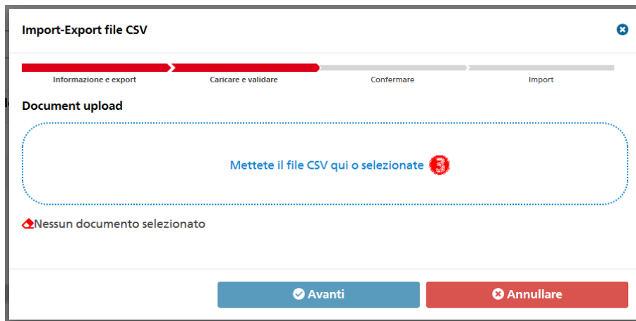
Figura 10: Finestra per l'importazione del file .csv