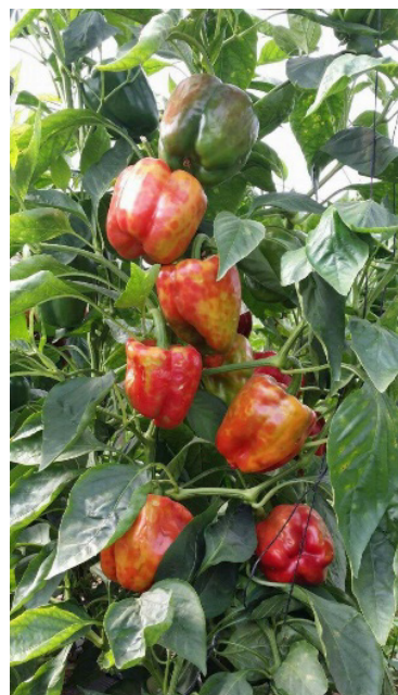
Colorazione a mosaico sui peperoni