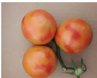
Colorazione a mosaico sui pomodori