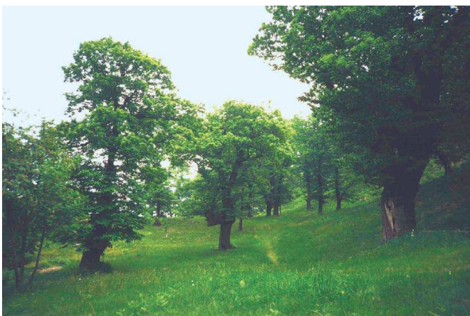
Abbildung 2 Kastanienselven in Arosio/TI