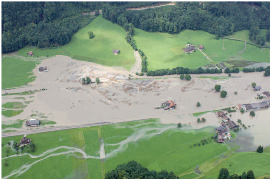
Abb. 1: Verlorenes Land: Engelberger Aa bei Wolfenschiessen.

Bei grossen Flüssen (Sohle > 5 m) ist dies nicht der Fall. Massgebend für die LN sind Art. 14 und 16 der Landwirtschaftlichen Begriffsverordnung LBV 1 . Wegen der Landbeschaffung ist die Landwirtschaft der wichtigste Partner bei Projekten im Zusammenhang mit Naturgefahren.