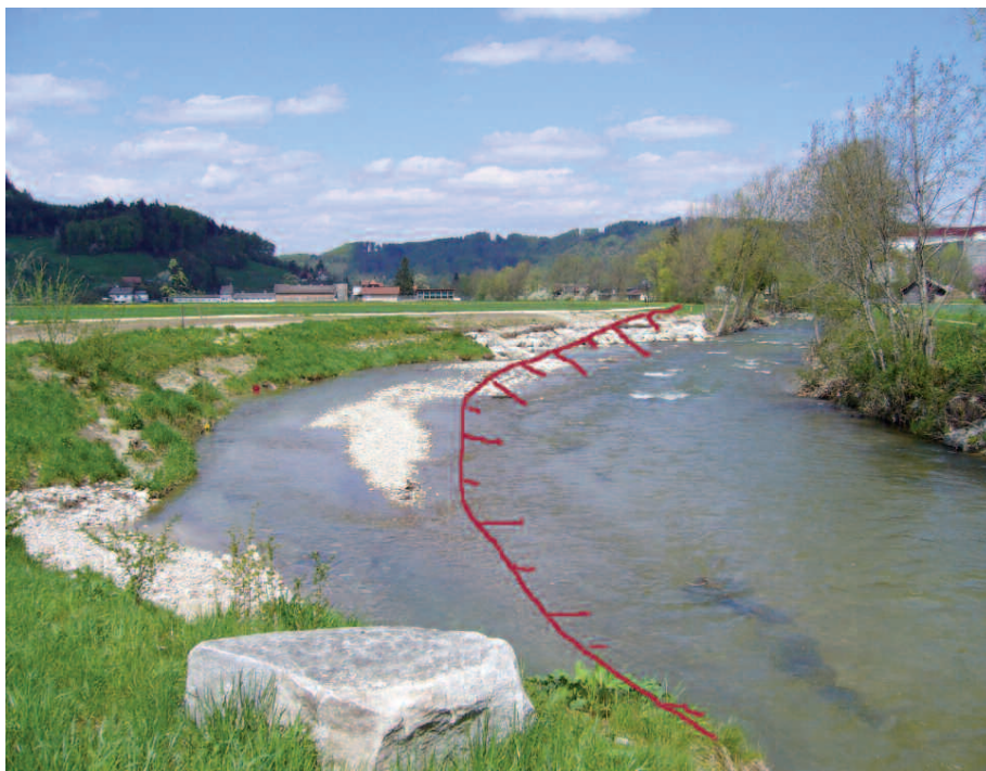
Abb. 3: Landbeschaffung für die Wigger bei Altishofen (Kanton Luzern) mit alter Uferlinie (rot).

dass die Wasserableitung oder Wasserrückhaltung bei einem Überlastfall funktionieren kann. Deshalb braucht es entsprechende vertragliche und grundbuchliche Regelungen. Ein Landerwerb ist dabei nicht unbedingt notwendig. Aber es müssen Entschädigungen für die Nutzungseinschränkungen und allfällige Schäden geregelt sein.