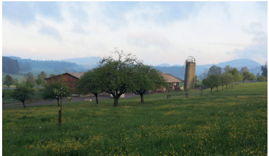
Photo principale: les pertes d'azote sous forme gazeuse nuisent à la biodiversité, causent l'acidification des sols, favorisent la formation de particules « secondaires » de poussières fines dans l'atmosphère et sont responsables de celle du gaz hilarant, qui a un effet néfaste sur le climat; les pertes d'azote sous forme de nitrates polluent les eaux souterraines et les eaux superficielles. Il est possible de trouver des solutions grâce à une approche portant sur l'ensemble de l'exploitation.

L'azote (N) est un élément chimique, dont les composés sont essentiels pour l'alimentation humaine et animale ainsi que pour la croissance des végétaux. C'est l'un des principaux éléments nutritifs et fertilisants utilisés pour fertiliser les cultures. Or, les excédents d'azote peuvent avoir un impact négatif sur l'environnement, comme la perte de biodiversité, l'émission de gaz à effet de serre ou la pollution des eaux souterraines et des eaux de surface, pour ne citer que quelques-unes des nombreuses conséquences défavorables. L'agriculture doit donc augmenter autant que possible l'efficacité de l'azote. Il s'agira d'épandre moins d'engrais azotés par quantité produite. L'efficacité de l'azote stagne autour des 30 % dans l'agriculture suisse, mais elle varie considérablement selon le type d'exploitation et selon l'altitude, ainsi qu'au sein d'un même type d'exploitation. Cependant, la réglementation et les instruments actuels des prestations écologiques requises ne permettent plus d'obtenir des améliorations notables. Par ailleurs, les objectifs environnementaux pour l'agri-