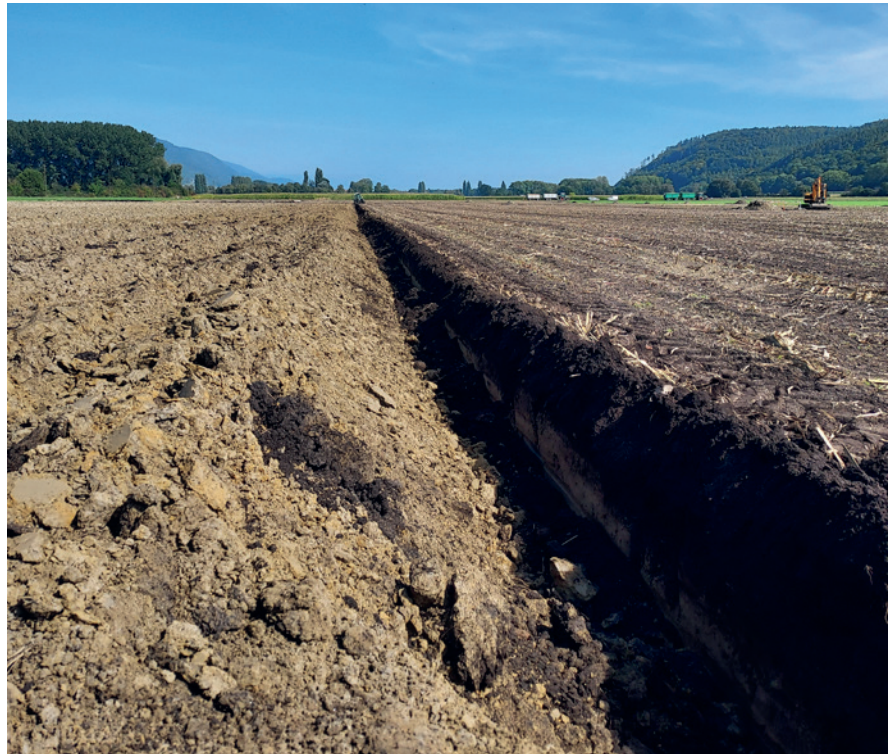
Photo de couverture: Le projet rassemble des expériences sur les mesures d'amélioration du sol comme le labour profond.

Le projet d'utilisation durable des ressources « Amélioration des sols du Seeland » a pour objectif de maintenir et