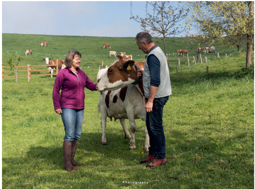
Dans le cadre de ce projet, les agriculteurs profitent des services de conseil en matière de médecine complémentaire pour leur troupeau ou certains de leurs animaux.

Les antibiotiques sont des médicaments utilisés pour soigner des maladies bactériennes en médecine humaine et vétérinaire qui tuent les bactéries ou ralentissent leur développement. Toutefois, les bactéries peuvent s'y adapter et former des résistances aux antibiotiques. Dès lors qu'une telle bactérie est à l'origine d'une infection, cette dernière est difficile, voire impossible à soigner. Les résistances aux antibiotiques sont une menace pour la santé publique mondiale. Il faut donc trouver des moyens pour réduire leur utilisation. En 2013 (au moment de la planification du projet), 52 250 kilos d'antibiotiques ont été administrés aux animaux de rente suisse. Bien que les quantités d'antibiotiques utilisées diminuent, les résistances ont tendance à augmenter. Mais quelle est la quantité d'antibiotiques nécessaire pour assurer la santé des animaux? La réponse à cette question est controversée. C'est dans cette optique qu'un réseau de conseil a été fondé en 2012, puis l'association Kometian en 2015, afin d'aider les éleveurs à maintenir leurs animaux en bonne santé grâce à la médecine complémentaire.