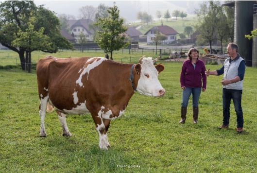
Consulenza in loco presso un agricoltore