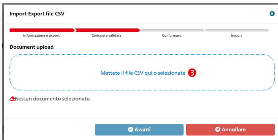
Figura 10: Finestra per l'importazione del file .csv